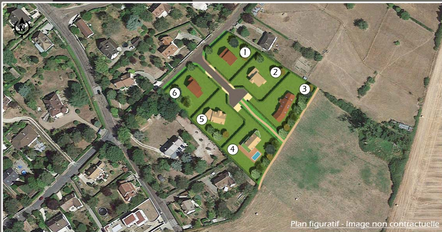
Plan figuratif - Image non contractuelle