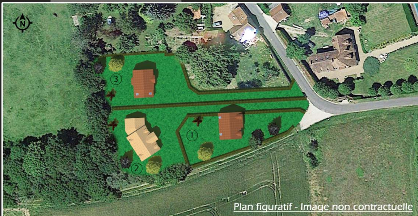
Plan figuratif - Image non contractuelle